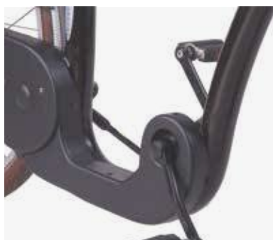
Ruime en lage instap